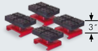
4 adaptadores bajos incluidos