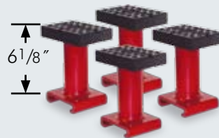
4 adaptadores altos incluidos